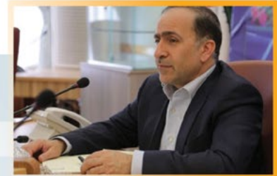
نایب رئیس شورای فناوری سلامت جناب آقای دکتر مصطفی قانعی